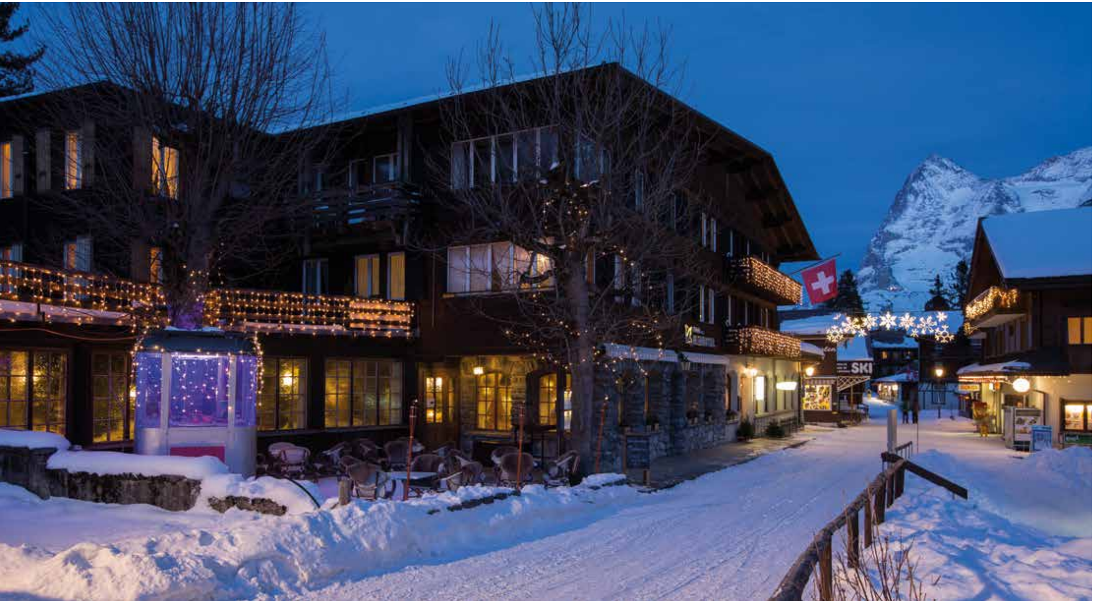
Hotel Blumental, Mürren