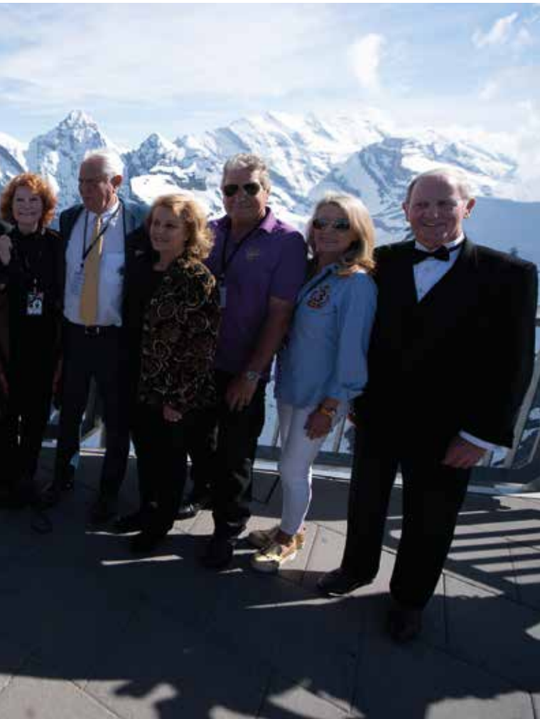
50 Jahre Bond-Film "Im Geheimdienst Ihrer Majestät", OHMSS-50-Event vom 1. Juni 2019

Die erfreuliche Entwicklung geht einher mit zahlreichen Massnahmen zu Gunsten der Schneesicherheit und der Attraktivitätssteigerung unseres Wintersportgebietes: