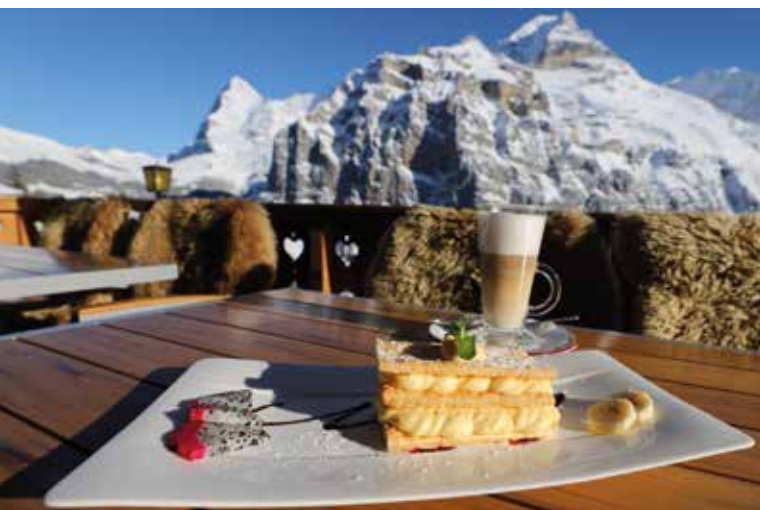
Terrasse Hotel Alpenruh, Mürren