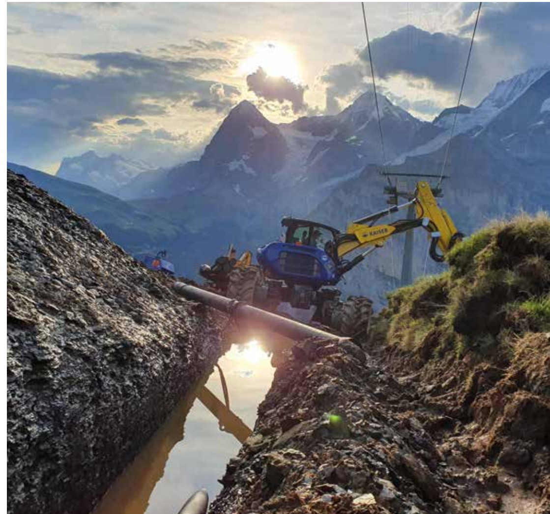
Bau Beschneigungsanlage, Schiltgrat