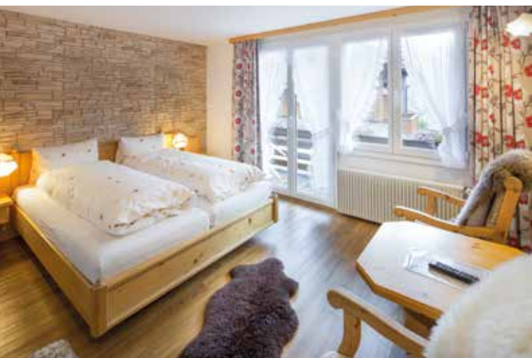
Hotel Blumental, Mürren