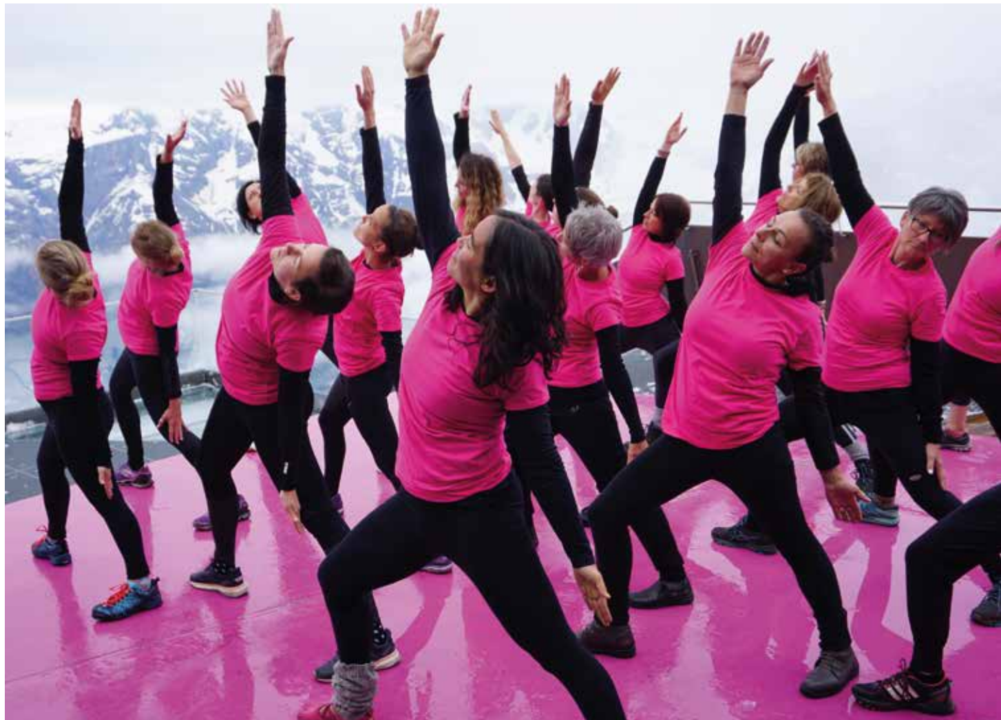
International Day of Yoga, 16. Juni 2019, Schilthorn