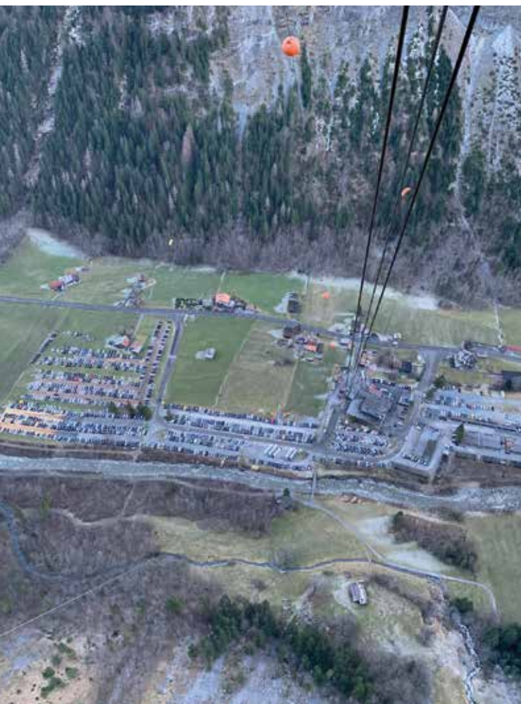
Weihnachtsferien, Parkplatz und Talstation, Stechelberg