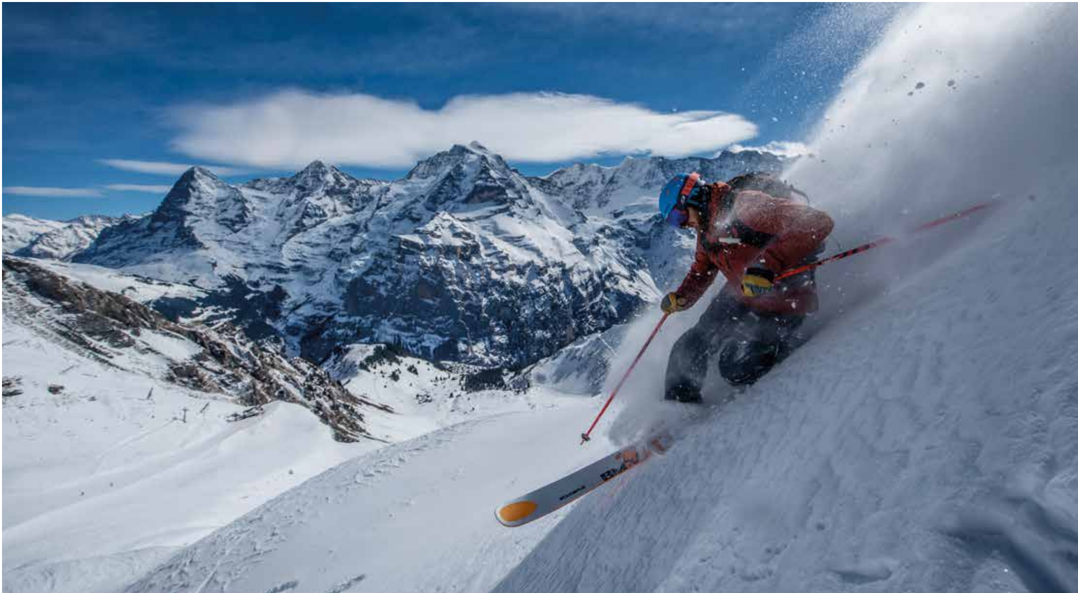
Telemark Only, jährlicher Event anfangs Mai