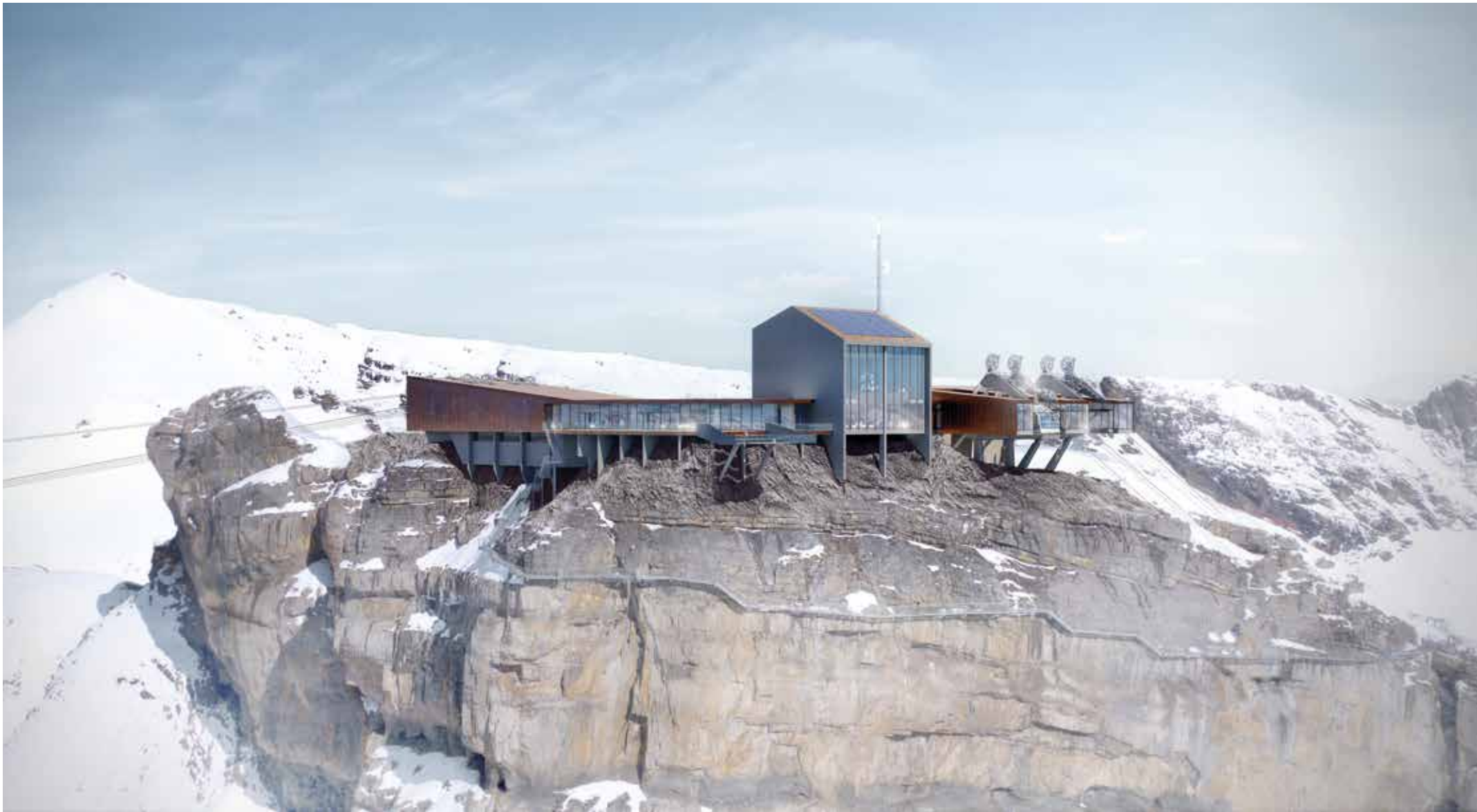
Station Birg, Stand Vorprojekt SCHILTHORNBAHN 20XX, März 2020