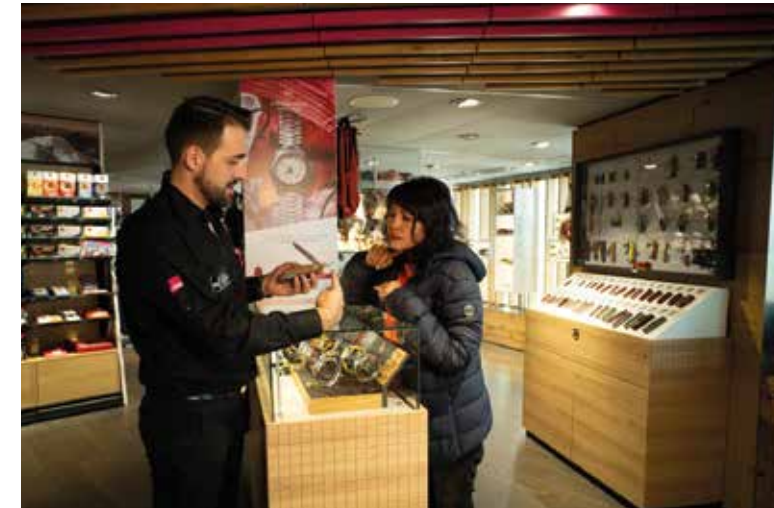
SKYLINE TOP SHOP, Schilthorn