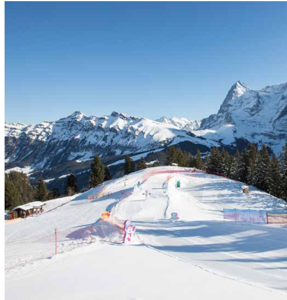
Lilly's magische Kidslope, Allmendhubel