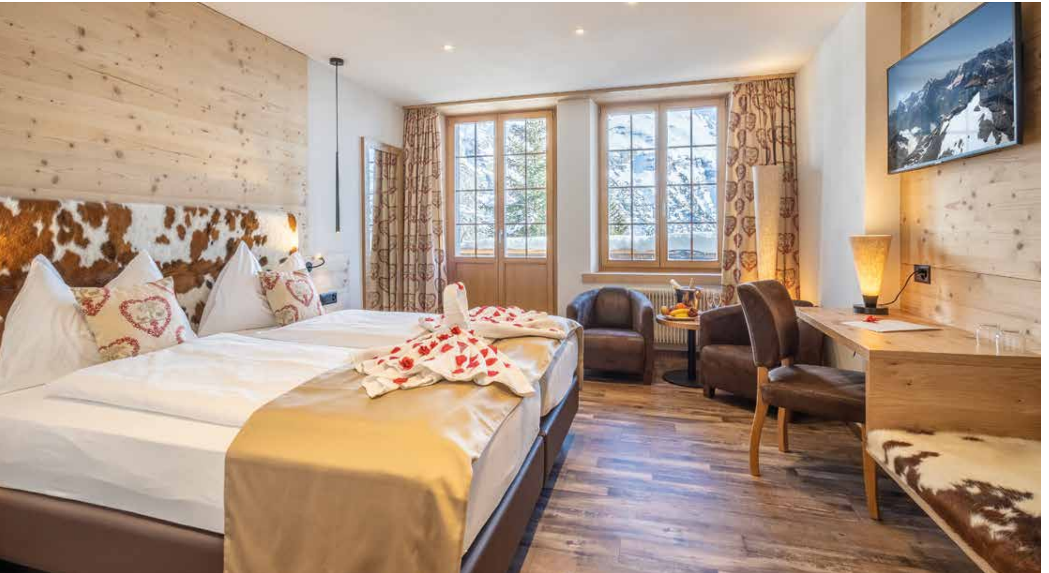
Renoviertes Hotelzimmer im Hotel Alpenruh, Mürren